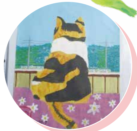
日本 ALS 協会 大分県支部

その他刺繍（日本筋ジストロフィー協会 大分県支部） 写真（全国パーキンソン病友の会 大分県支部） 大分県立看護科学大学のブース等あります。