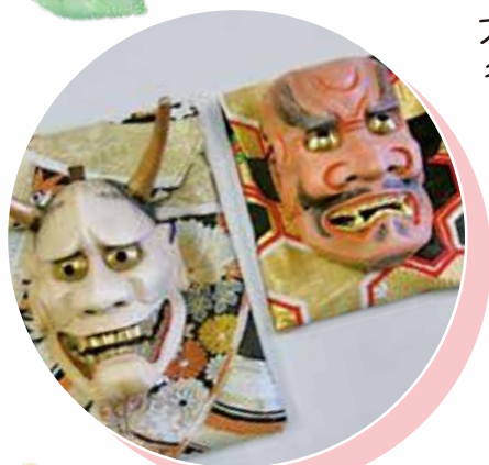
大分県腎臓病協議会