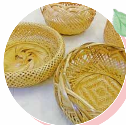
大分脊柱靭帯骨化症 友の会