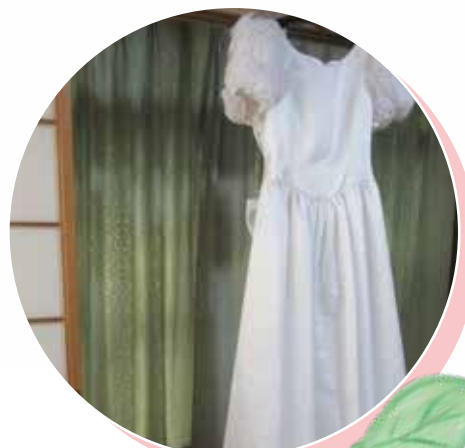
大分県網膜色素 変性症協会