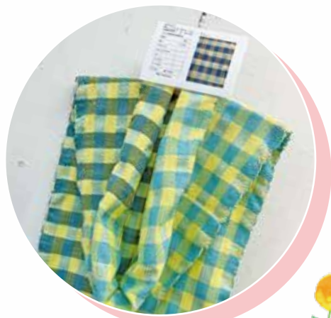
大分脊髄小脳変性症 多系統萎縮症友の会